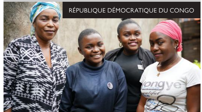
RÉPUBLIQUE DÉMOCRATIQUE DU CONGO

Nous enseignons leurs droits aux enfants et leurs moyens de devenir activistes, par le biais de groupes comme les parlements d'enfants et les clubs de jeunes pour donner aux filles les moyens de gagner en autonomie. Par exemple, à Tunyao, au Kenya, 2 550 filles et garçons ont appris à défendre leurs droits.